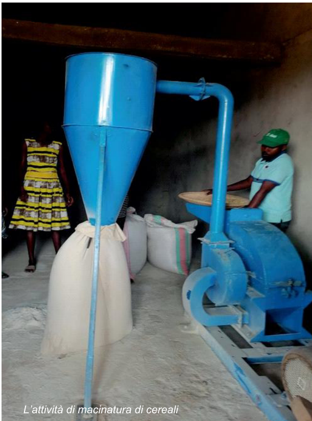
L'attività di macinatura di cereali

Va detto che tutti i gruppi hanno terminato la