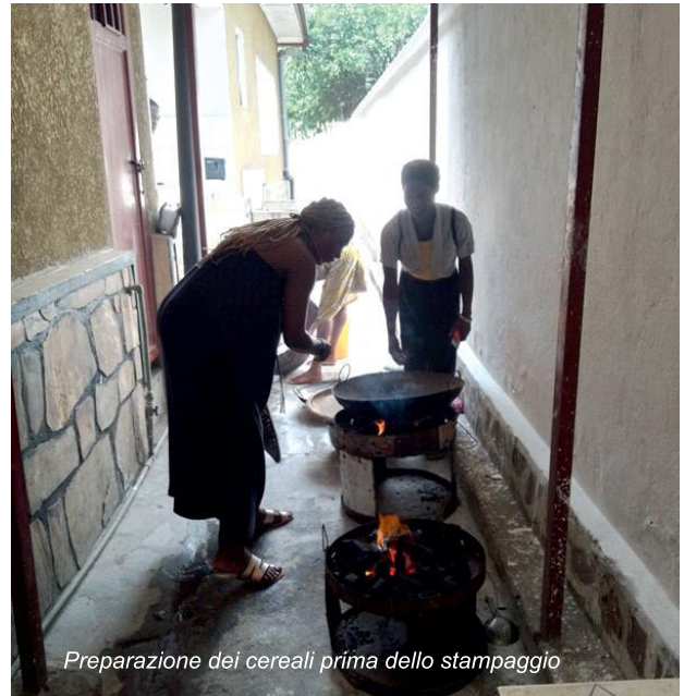
Preparazione dei cereali prima dello stampaggio

commercializzazione della farina di porridge. Va anche notato che si tengono regolarmente incontri di sensibilizzazione per queste madri single affinché si sentano responsabili e attive in questo progetto. Tuttavia, scopriamo che c'è chi non vi partecipa: alcune donne raramente si presentano nella preparazione dei semi o nelle attività di confezionamento ed etichettatura della farina di porridge. Finora solo un gruppo VSLA di madri single continua mentre un altro si è sciolto. La vendita della farina di porridge non è andata bene come speravamo, soprattutto per il gruppo VSLA che si è sciolto. Abbiamo fatto verifiche sul campo per identificare le madri single che vogliono continuare con ONKIDI . Sono state individuate dieci ragazze madri e con loro abbiamo già avviato la produzione di ciambelle a base di farina e patate dolci. ■