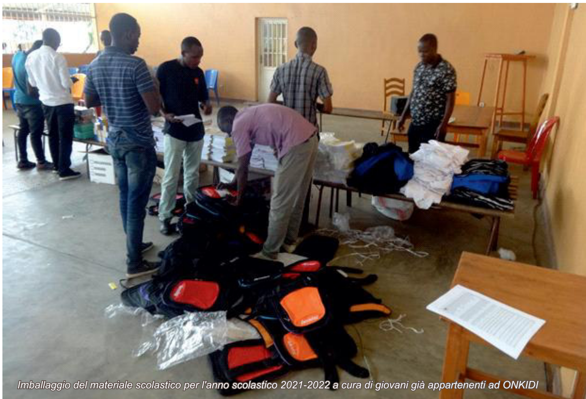
Imballaggio del materiale scolastico per l'anno scolastico 2021-2022 a cura di giovani già appartenenti ad ONKIDI

promossi, e 11 hanno potuto conseguire un diploma o un certificato. L'assistenza sanitaria è stata fornita a 43 ragazzi mentre il supporto psicologico ha coinvolto tutto il gruppo, anche se ad aprile di quest'anno è andata via la psicologa che si occupava regolarmente di questo supporto psicosociale. Sono state fornite le razioni alimentari per i giovani più vulnerabili e l'assistenza sanitaria.