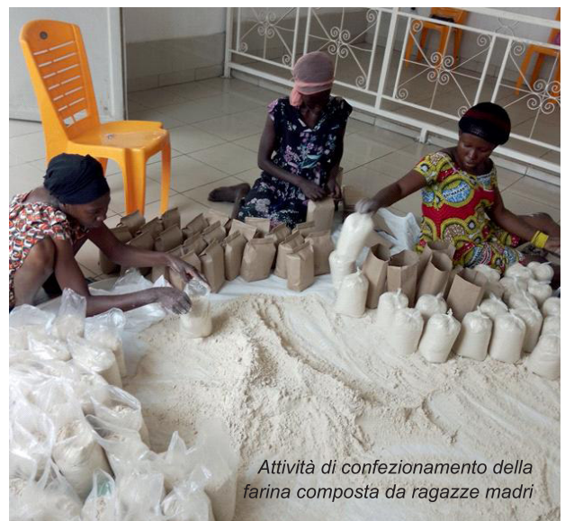
Attività di confezionamento della farina composta da ragazze madri

commercializzazione della farina di porridge. Va anche notato che si tengono regolarmente incontri di sensibilizzazione per queste madri single affinché si sentano responsabili e attive in questo progetto. Tuttavia, scopriamo che c'è chi non vi partecipa: alcune donne raramente si presentano nella preparazione dei semi o nelle attività di confezionamento ed etichettatura della farina di porridge. Finora solo un gruppo VSLA di madri single continua mentre un altro si è sciolto. La vendita della farina di porridge non è andata bene come speravamo, soprattutto per il gruppo VSLA che si è sciolto. Abbiamo fatto verifiche sul campo per identificare le madri single che vogliono continuare con ONKIDI . Sono state individuate dieci ragazze madri e con loro abbiamo già avviato la produzione di ciambelle a base di farina e patate dolci. ■