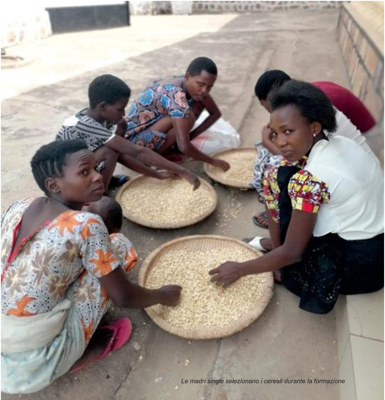
Le madri single selezionano i cereali durante la formazione

formate nella tecnica VSLA hanno aderito ai gruppi.