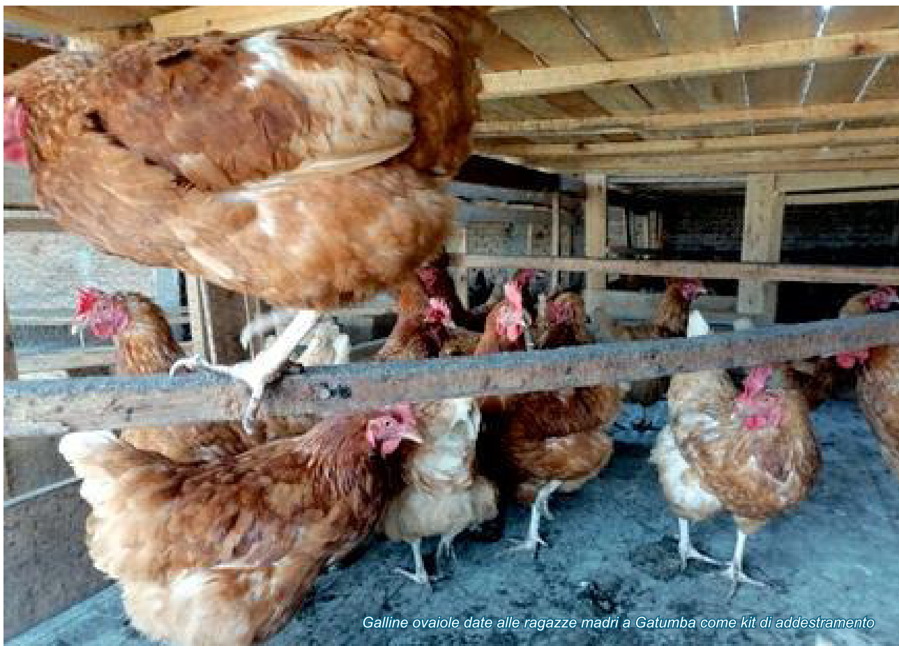
Galline ovaiole date alle ragazze madri a Gatumba come kit di addestramento

Il progetto " TWIYUNGE " dell'organizzazione Nkurikira per le Iniziative di Sviluppo Integrale " ONKIDI " in acronimo è in corso di realizzazione grazie ai finanziamenti dell'Ambasciata degli Stati Uniti d'America in Burundi. Questo progetto mira a sostenere le madri single