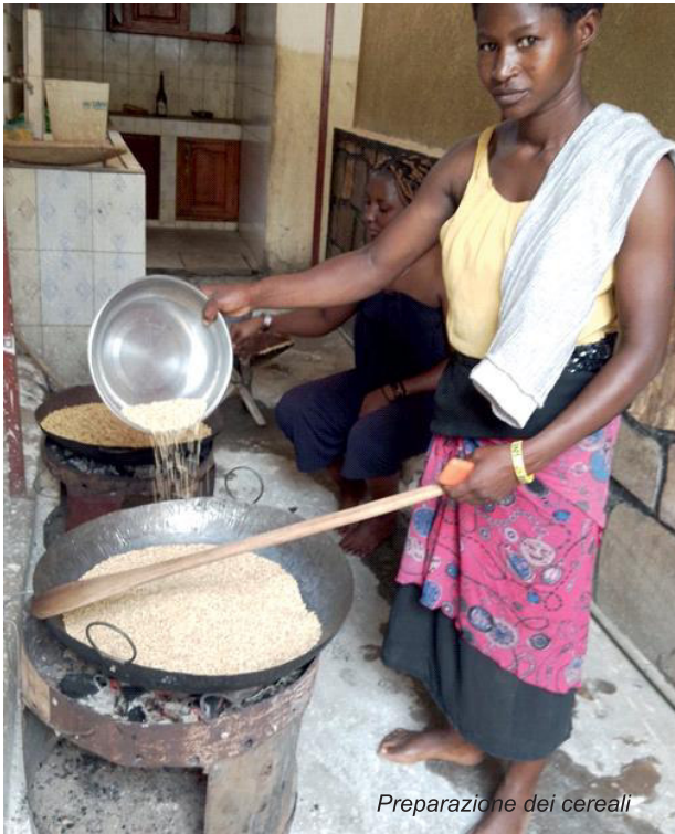
Preparazione dei cereali

macinati da un'altra macchina in attesa che venisse corretto il difetto del mulino ONKIDI . Dopo di ciò è ripresa l'attività di stampaggio per l'altro gruppo.