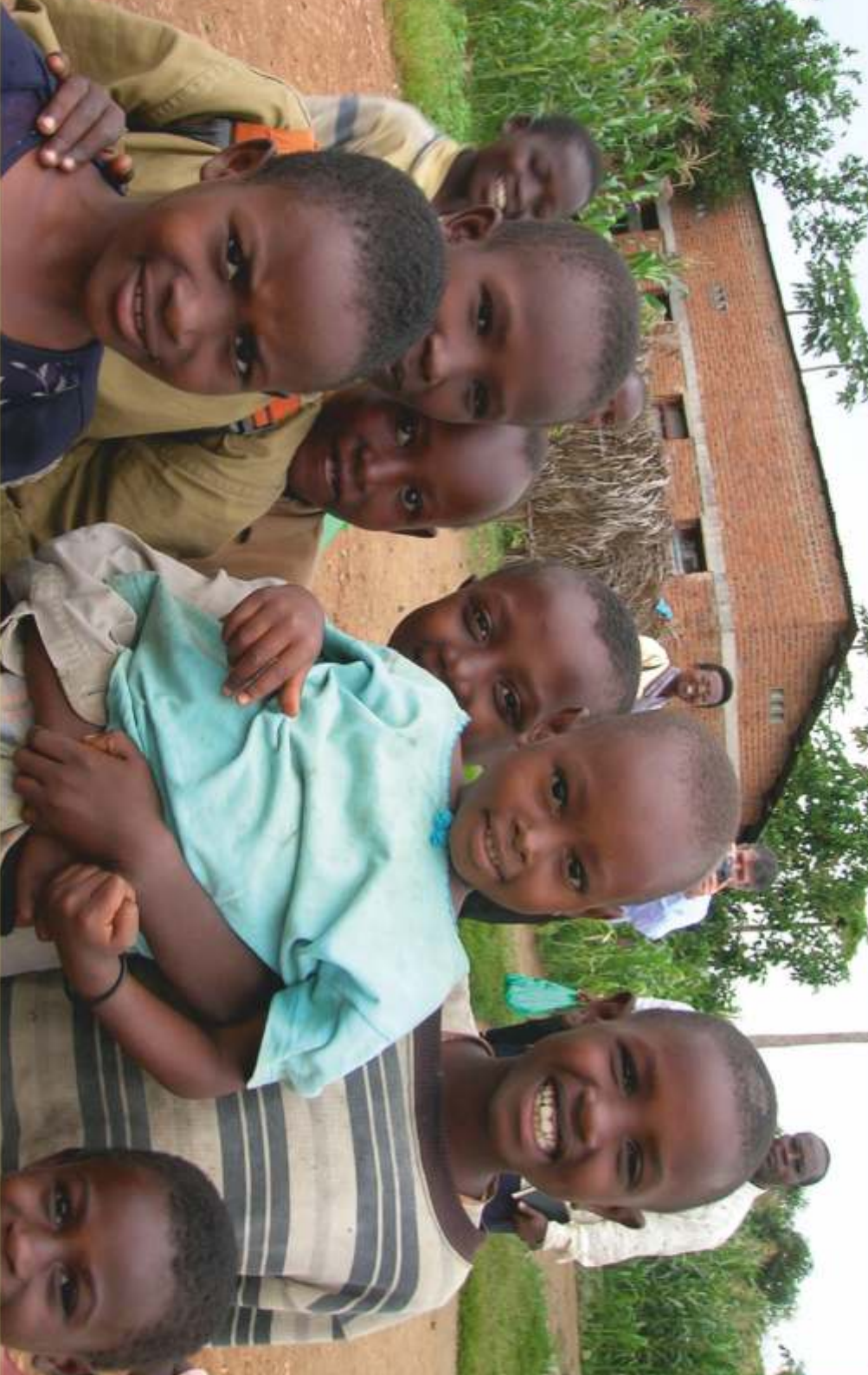
Bambini di Bujumbura